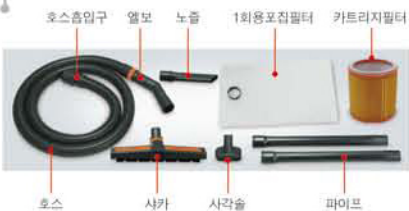
호스 흡입구, 엘보, 노즐, 1회용포집필터, 카트리지필터, 호스, 사카, 사각솔, 파이프