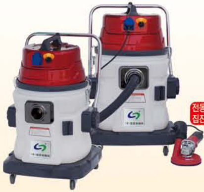
전동공구 및 집진카바 별매품

카트리지필터와 대용량 2중필터 장착! 공구와 청소기 개별작동 및 동시 작동! 먼지털이봉 장착!