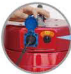
헤드 전기콘센트 장착 (12A미만 사용)