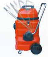
손잡이 앞, 뒤 회전으로 이동이 편리함.