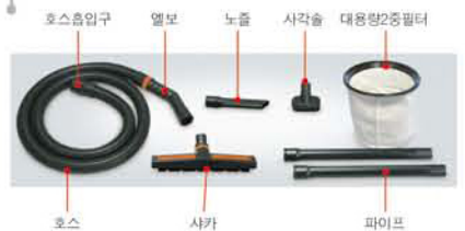
호스 흡입구, 엘보, 노즐, 사각솔, 대용량2중필터, 호스, 사카, 파이프

특징 PCB 내장형으로 스위치를 자동으로 돌리면 그라인더등의 공구를 작동 시켰을때 청소기가 자동으로 작동하며 공구를 꺼올때는 5초후에 청소기도 같이 꺼집니다. 스위치를 수동으로 돌리면 연결된 공구와 상관없이 청소기는 독립적으로 작동됩니다.