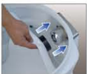
포집필터 장착 장면

자동 중립 수동 연결된공구와 청소기 작동 공구, 청소기 멈춤 청소기만 작동