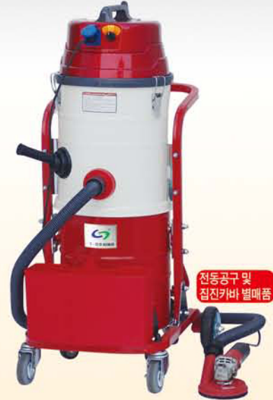
전동공구 및 집진카바 별매품