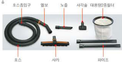
호스 흡입구, 엘보, 노즐, 사각솔, 대용량2중필터, 호스, 사카, 파이프